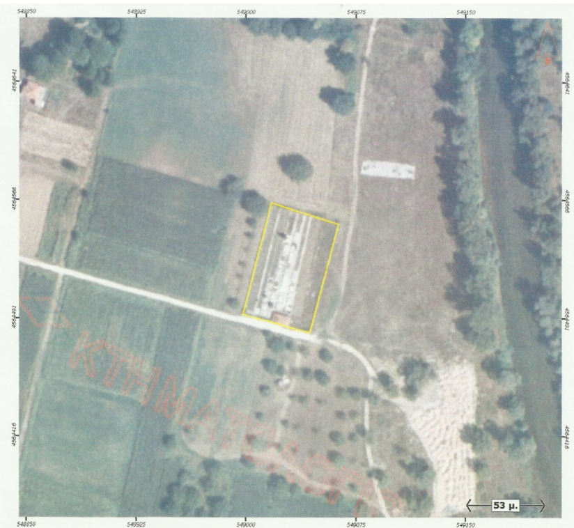
Ορθοφωτογραφία 21. Δημοτικό Κοιμητήριο Πασχαλιάς