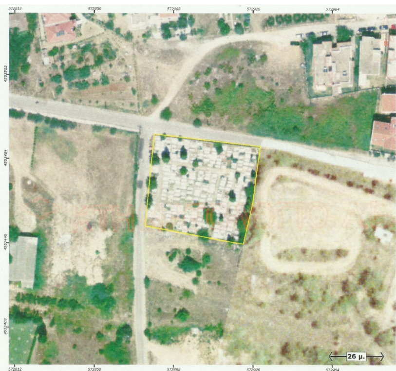
Ορθοφωτογραφία 2. Δημοτικό Κοιμητήριο Ν. Χρύσας