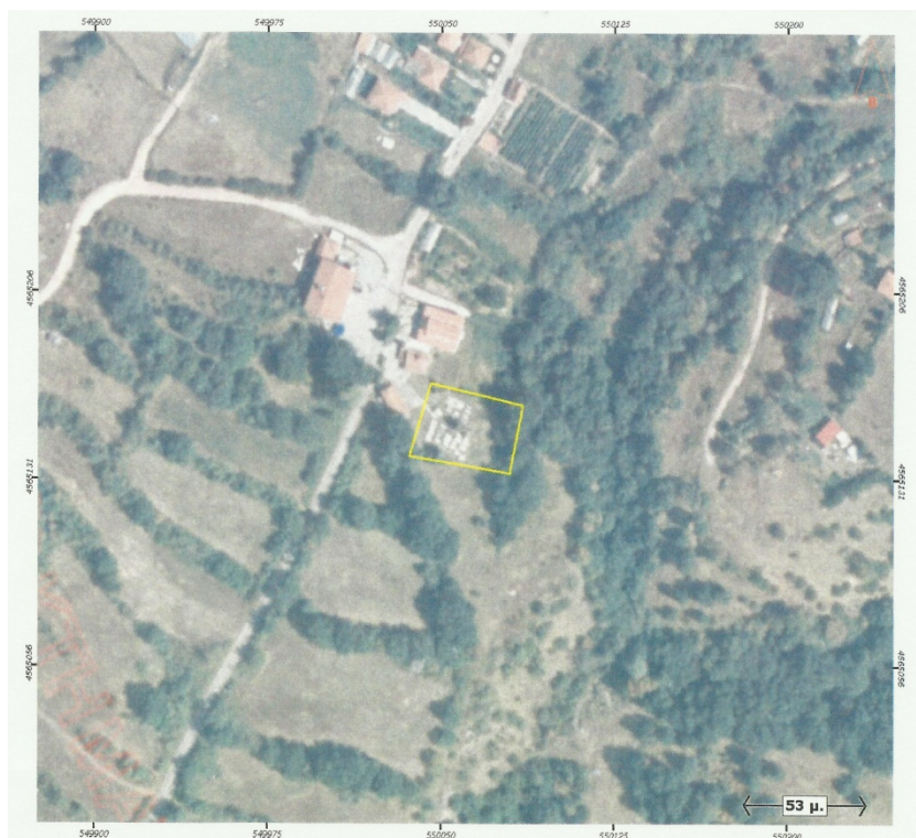
Ορθοφωτογραφία 20. Δημοτικό Κοιμητήριο Σταυροχωρίου