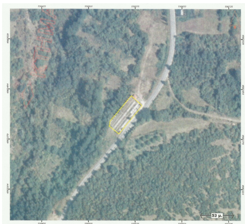
Ορθοφωτογραφία 16. Β' Δημοτικό Κοιμητήριο Δαφνών