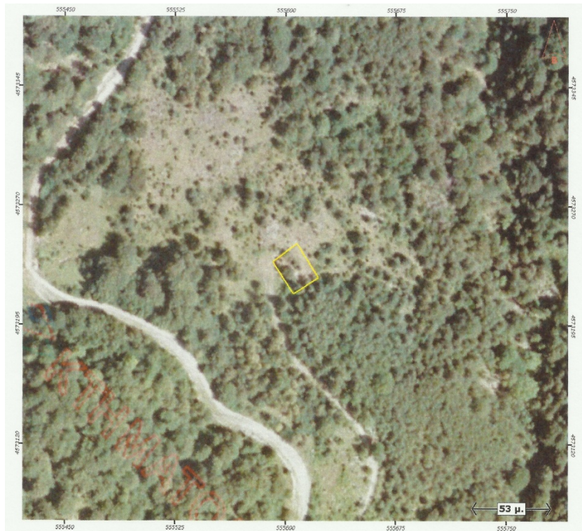
Ορθοφωτογραφία 13. Δημοτικό Κοιμητήριο Λειβαδίτη