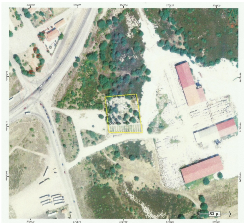
Ορθοφωτογραφία 6. Δημοτικό Κοιμητήριο Πετροχωρίου