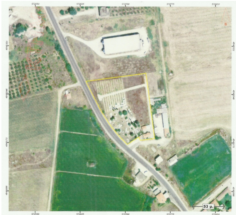
Ορθοφωτογραφία 5. Δημοτικό Κοιμητήριο Λεύκης