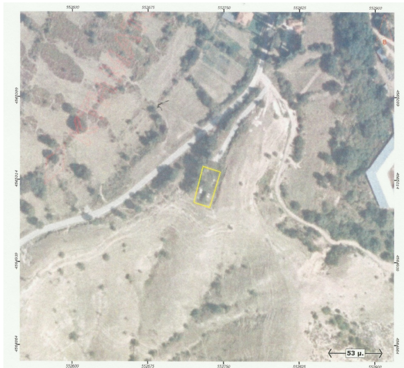
Ορθοφωτογραφία 17. Δημοτικό Κοιμητήριο Άνω Ιωνικού