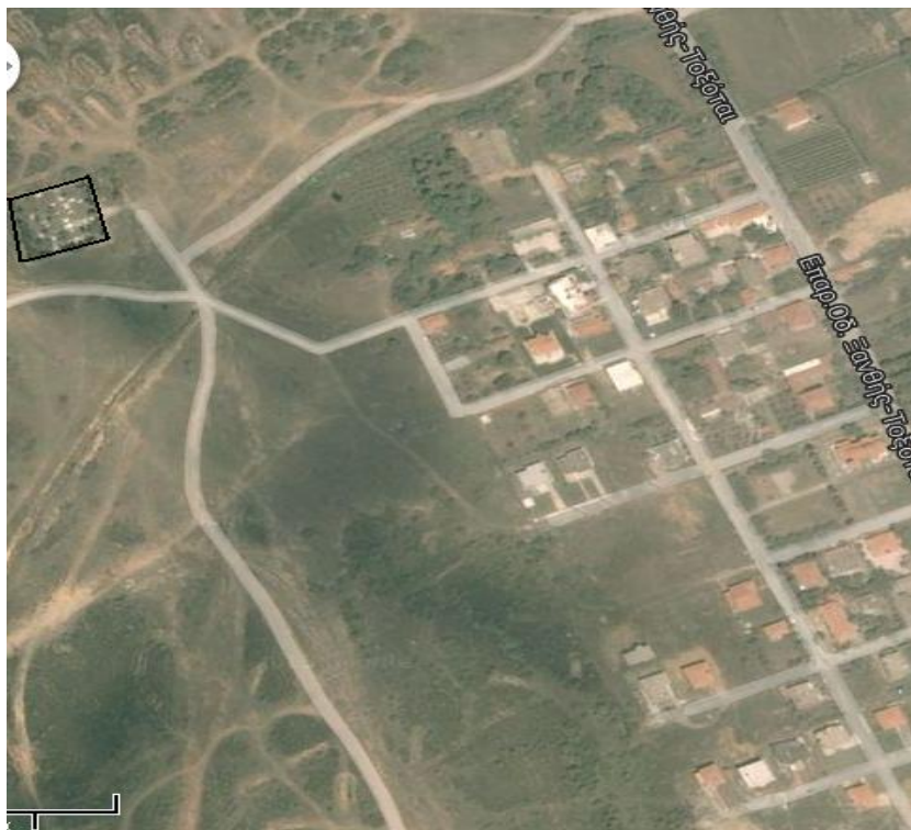
Ορθοφωτογραφία 4. Δημοτικό Κοιμητήριο Ν. Μορσίνης