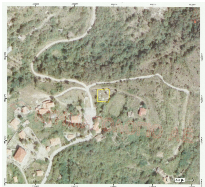
Ορθοφωτογραφία 10. Δημοτικό Κοιμητήριο Μαργαριτίου