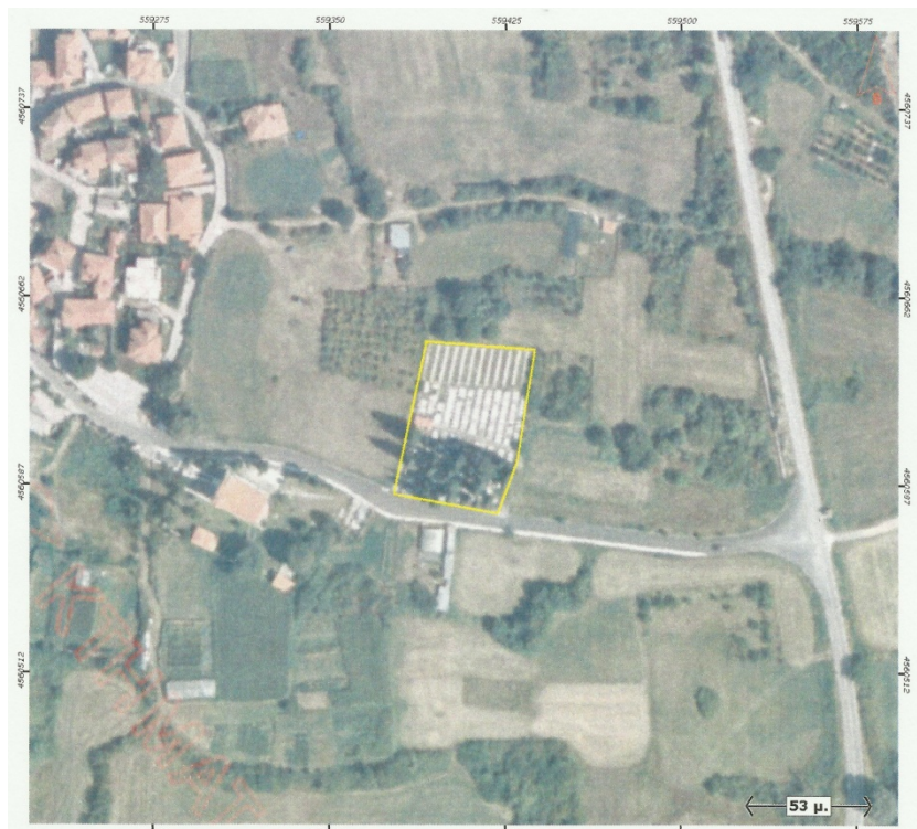
Ορθοφωτογραφία 8. Δημοτικό Κοιμητήριο Σταυρούπολης