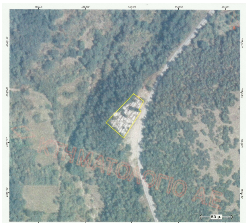
Ορθοφωτογραφία 15. Α' Δημοτικό Κοιμητήριο Κομνηνών