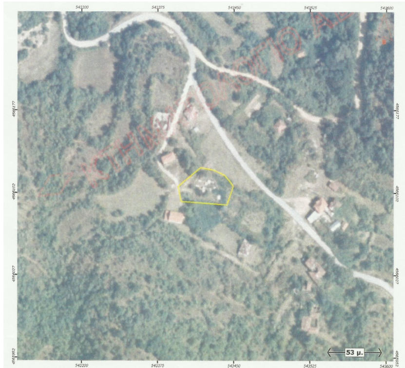
Ορθοφωτογραφία 23. Δημοτικό Κοιμητήριο Χαλεπτιού