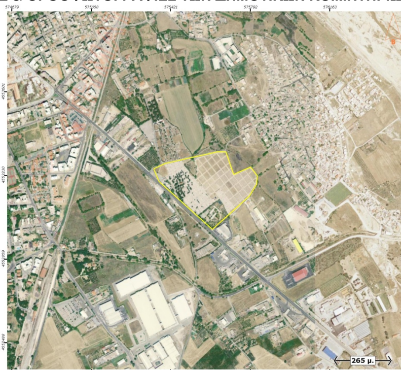
Ορθοφωτογραφία 1. Δημοτικό Κοιμητήριο Ξάνθης (Κεντρικό Δημοτικό Κοιμητήριο)