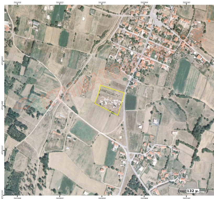
Ορθοφωτογραφία 7. Δημοτικό Κοιμητήριο Κιμμερίων