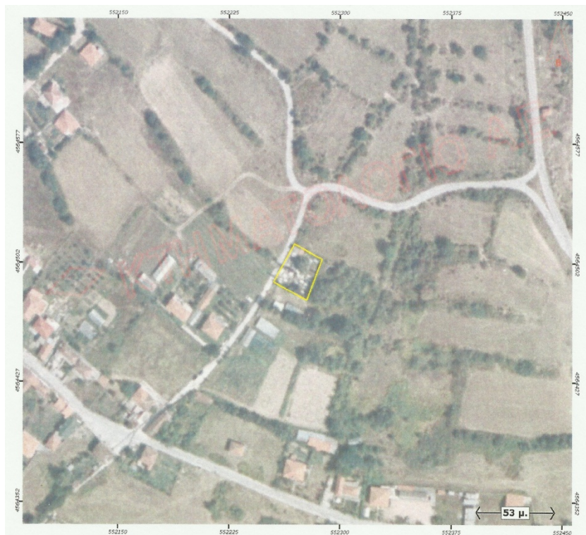
Ορθοφωτογραφία 18. Δημοτικό Κοιμητήριο Κάτω Ιωνικού