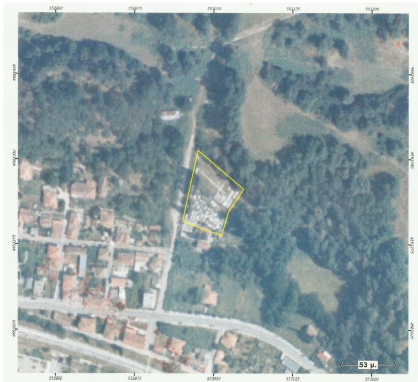
Ορθοφωτογραφία 19. Δημοτικό Κοιμητήριο Νεοχωρίου