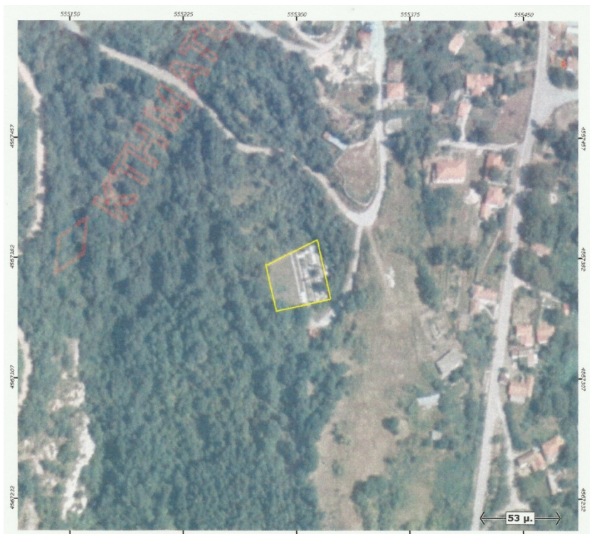
Ορθοφωτογραφία 11. Δημοτικό Κοιμητήριο Άνω Καρσοφύτου