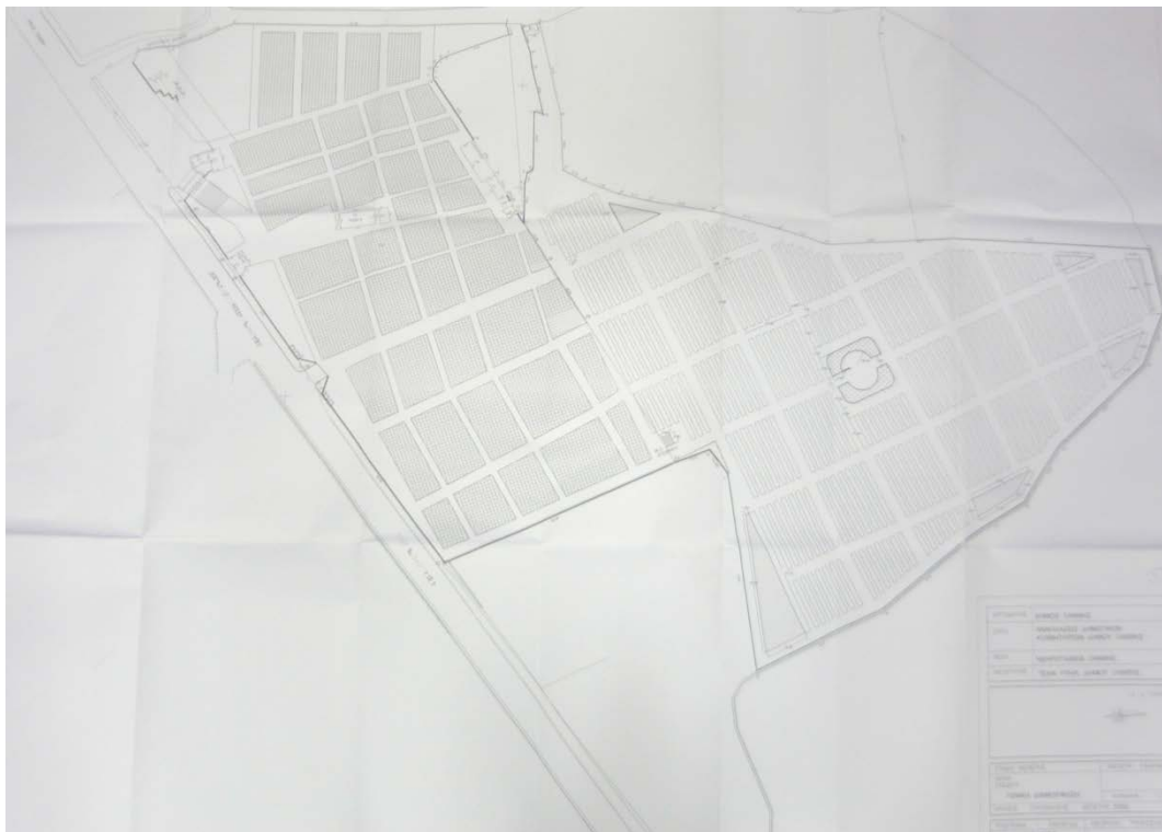
Κάτοψη 1. Δημοτικό Κοιμητήριο Ξάνθης (Κεντρικό Δημοτικό Κοιμητήριο)