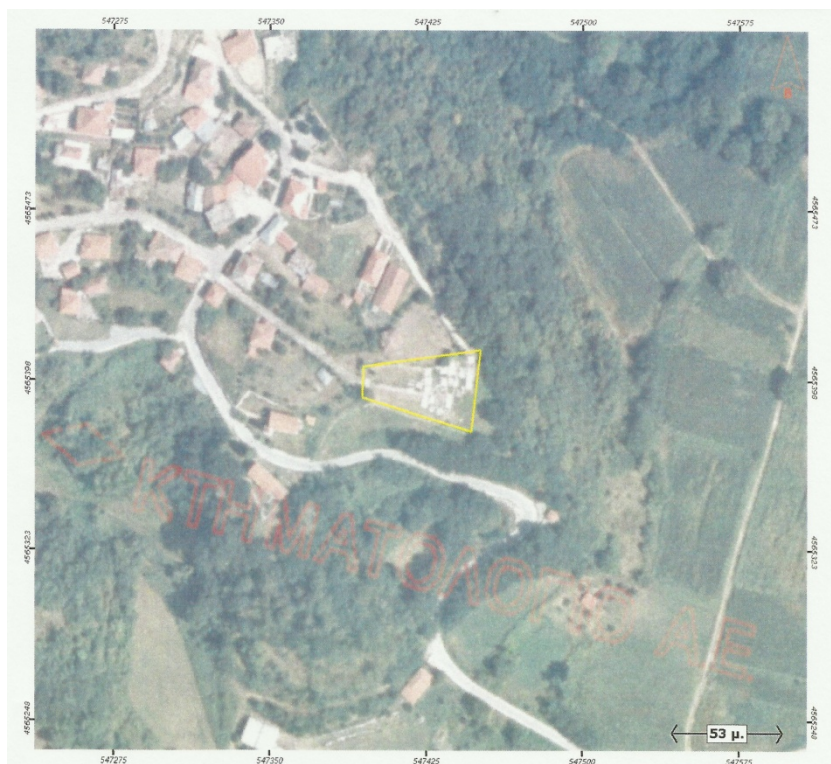
Ορθοφωτογραφία 22. Δημοτικό Κοιμητήριο Δρυμιάς