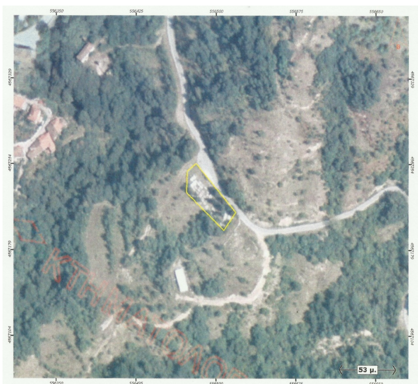
Ορθοφωτογραφία 12. Δημοτικό Κοιμητήριο Κάτω Καρσοφύτου