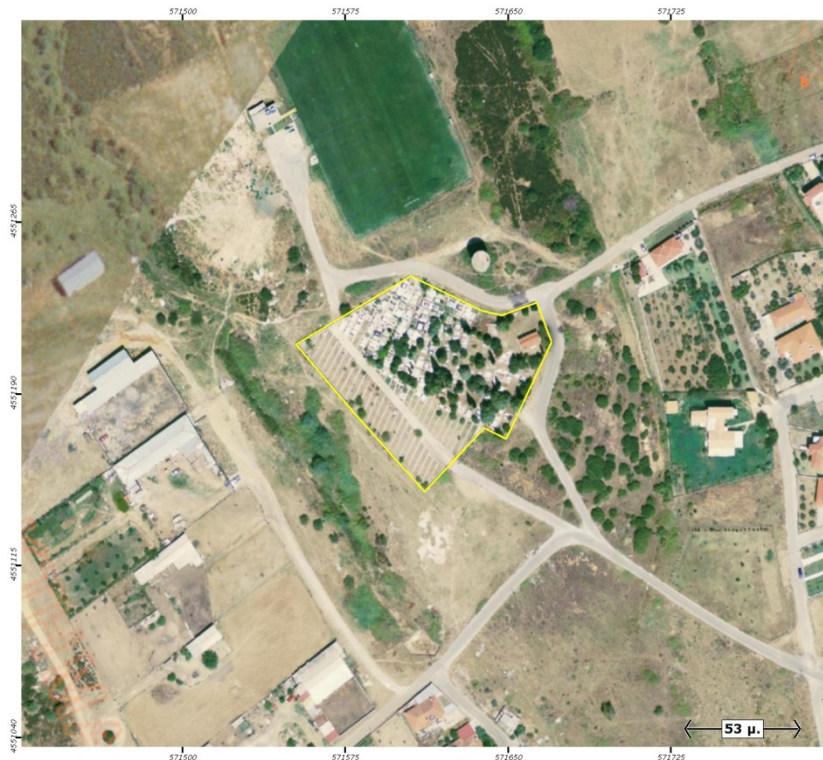
Ορθοφωτογραφία 3. Δημοτικό Κοιμητήριο Ευμοίρου