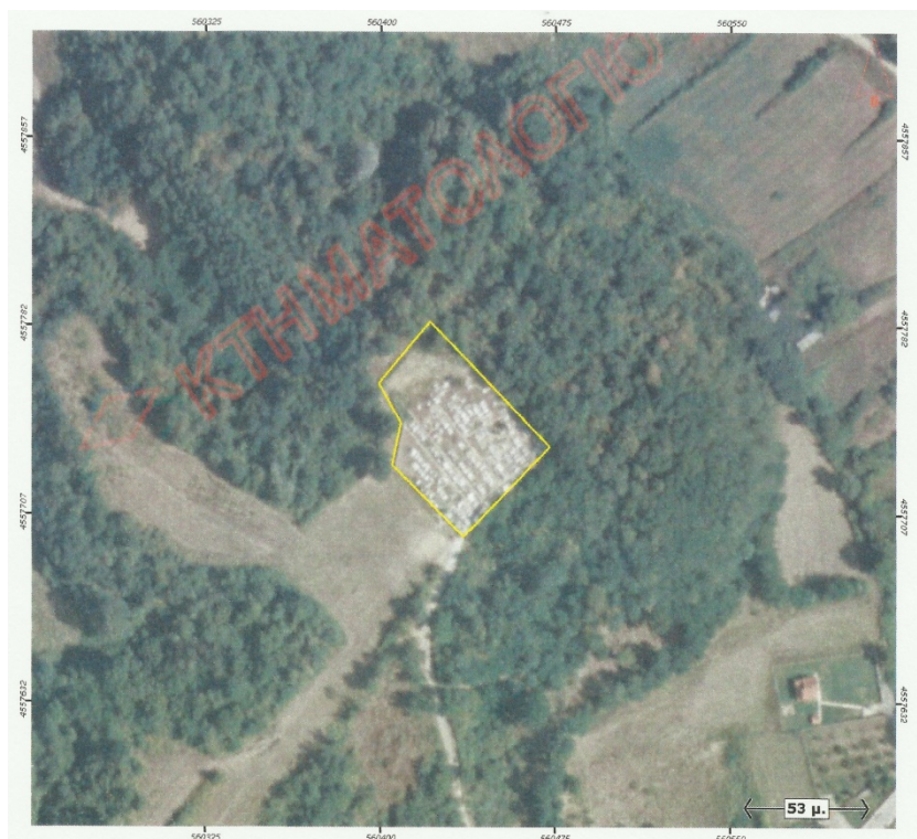
Ορθοφωτογραφία 14. Δημοτικό Κοιμητήριο Κομνηνών