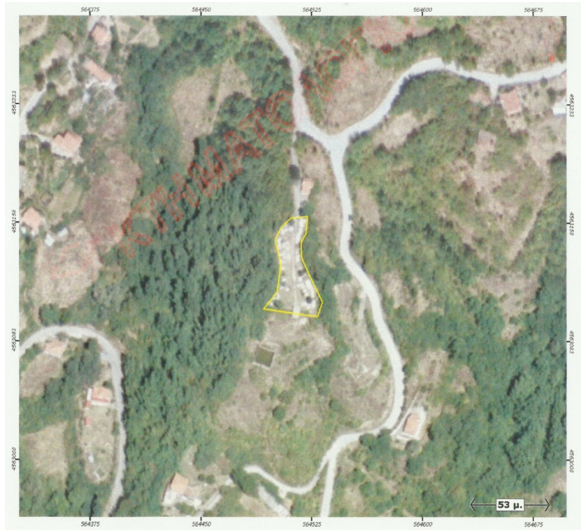
Ορθοφωτογραφία 9. Δημοτικό Κοιμητήριο Λυκοδρομίου