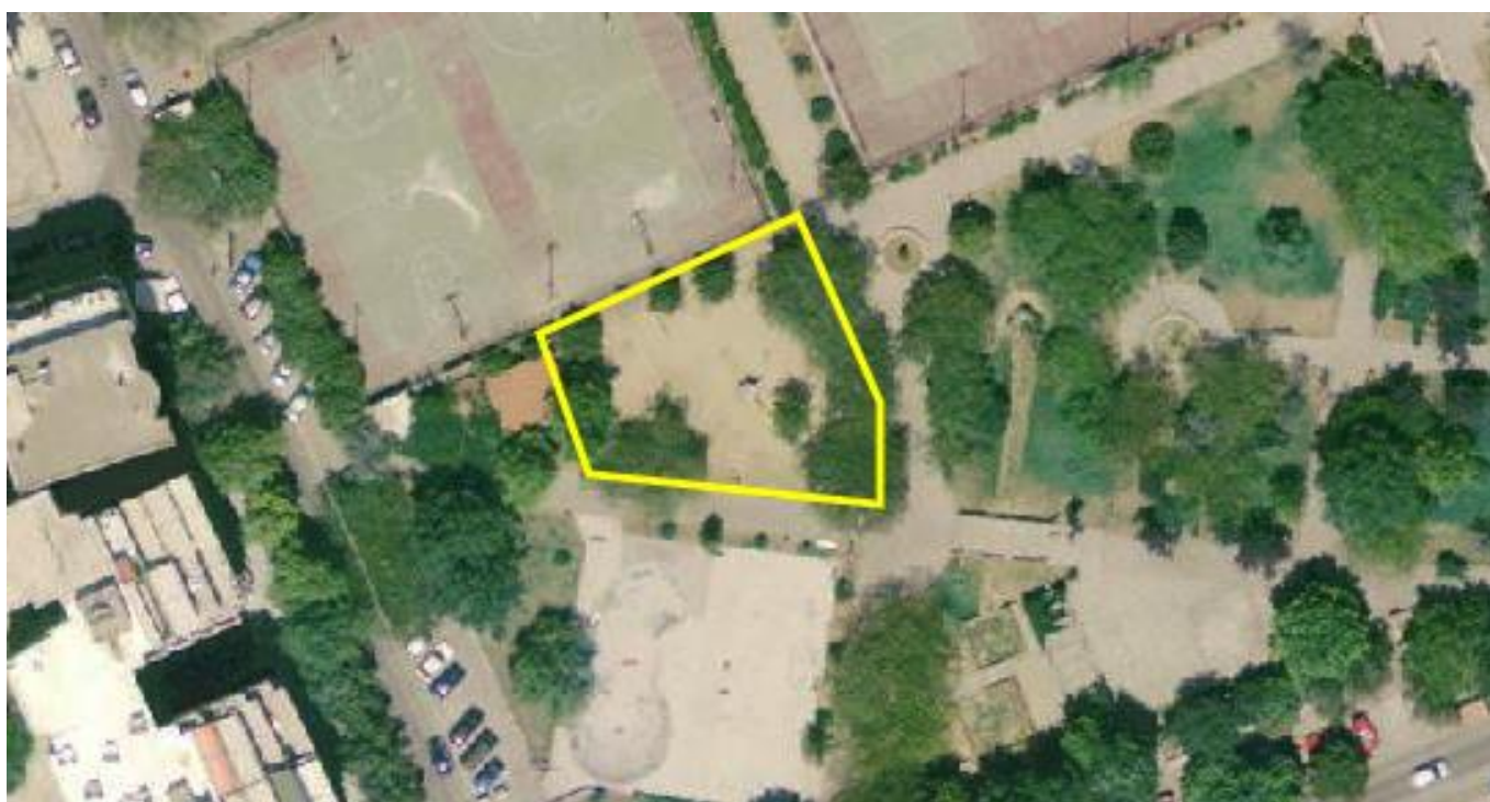
Αεροφωτογραφία περιοχής επέμβασης.