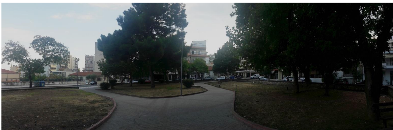
Πανοραμική φωτογραφία περιοχής επέμβασης.