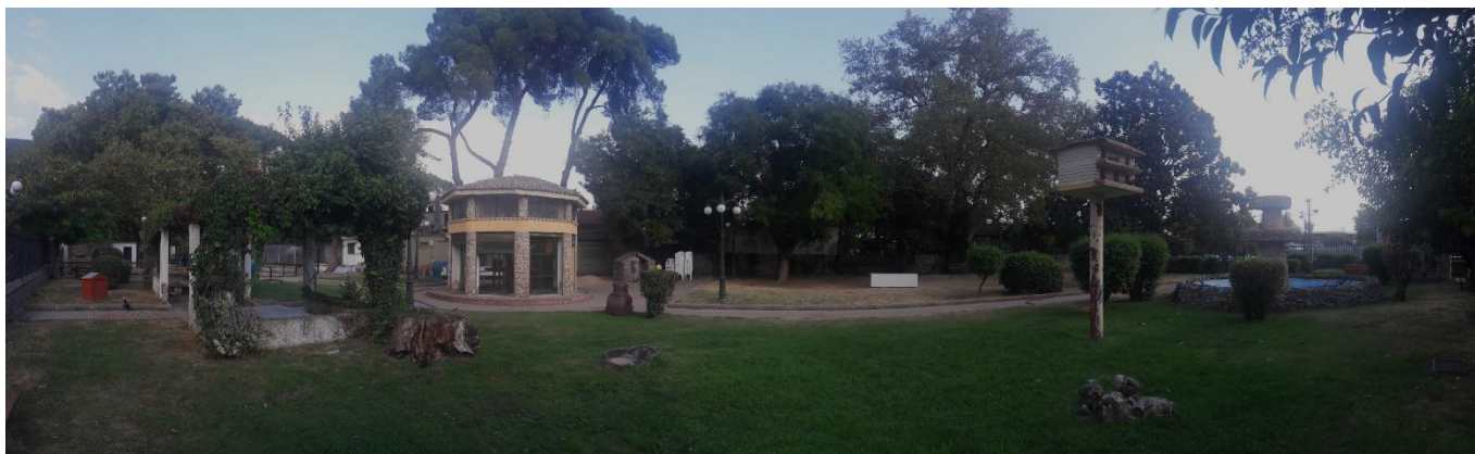
Πανοραμική φωτογραφία περιοχής επέμβασης.