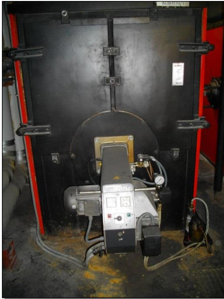
Εικόνα 1.1: Θέρμανσης