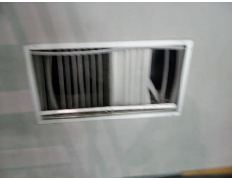
Εικόνα 1.7: Κατεστραμμένο στόμιο προσαγωγής – απαγωγής αέρα

Όπως φαίνεται στην εικόνα 1.7 τα στόμια, εξόδου του θερμού ή ψυχρού αέρα, που βρίσκονται στα κάτω τμήμα των κερκίδων, έχουν καταστραφεί από το χρόνο και τις συνθήκες λειτουργίας και απαιτείται η αποκατάστασή τους.