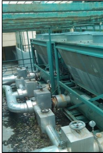
Εικόνα 1.3: Αερόψυκτος ψύκτης

Τα τεχνικά χαρακτηριστικά των υφιστάμενων ψυκτών είναι τα παρακάτω: