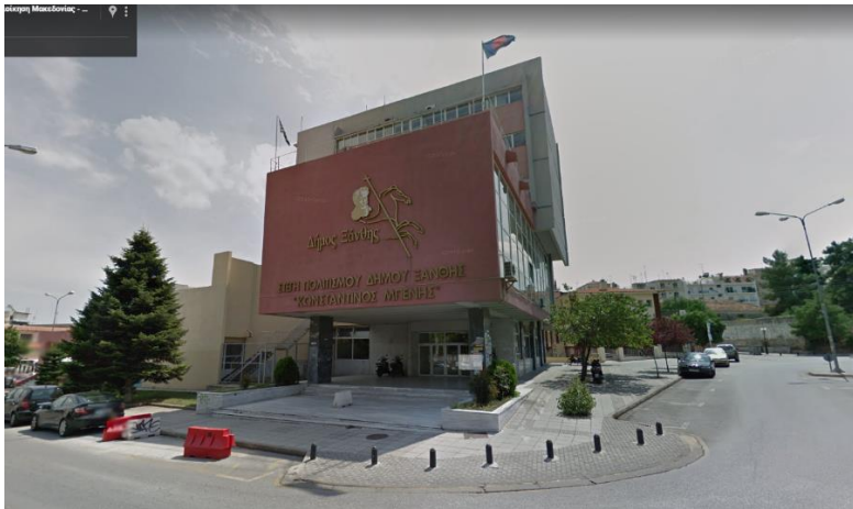
Εικόνα 1: Βόρεια όψη