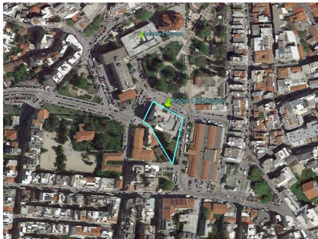
Εικόνα 2: Αεροφωτογραφία της περιοχής

Το κτίριο δεν είναι χαρακτηρισμένο ως μνημείο ή διατηρητέο ή παραδοσιακό.