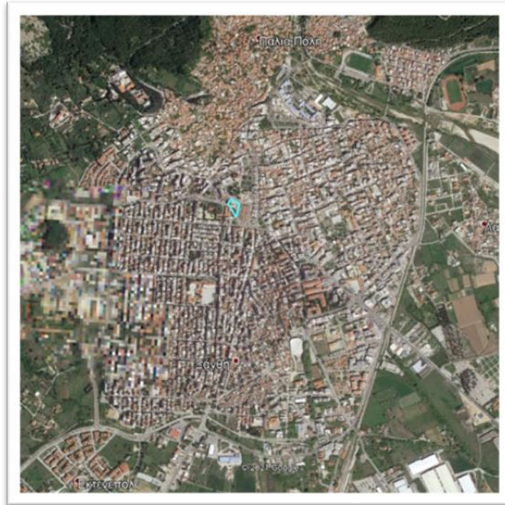
Εικόνα 1: Αεροφωτογραφία της πόλης της Ξάνθης- Επισημαίνεται η θέση του οικοπέδου

Το κλειστό αμφιθέατρο που διαθέτει το κτήριο, είναι το μοναδικό κλειστό αμφιθέατρο της πόλης και λειτουργεί ανελλιπώς έως και σήμερα. Σε αυτό διοργανώνονται βραδιές λαογραφίας με παραδοσιακούς χορούς από ελληνικά και ξένα συγκροτήματα, θεατρικές παραστάσεις από τοπικά ερασιτεχνικά σχήματα ή θιάσους για μικρούς και μεγάλους, επιδείξεις χορού από σχολές της Ξάνθης (δημόσιες ή ιδιωτικές) ή άλλα σχήματα, εκδηλώσεις (ομιλίες, παρουσιάσεις βιβλίων και εορτασμοί) και συναυλίες με όλα τα είδη της μουσικής.