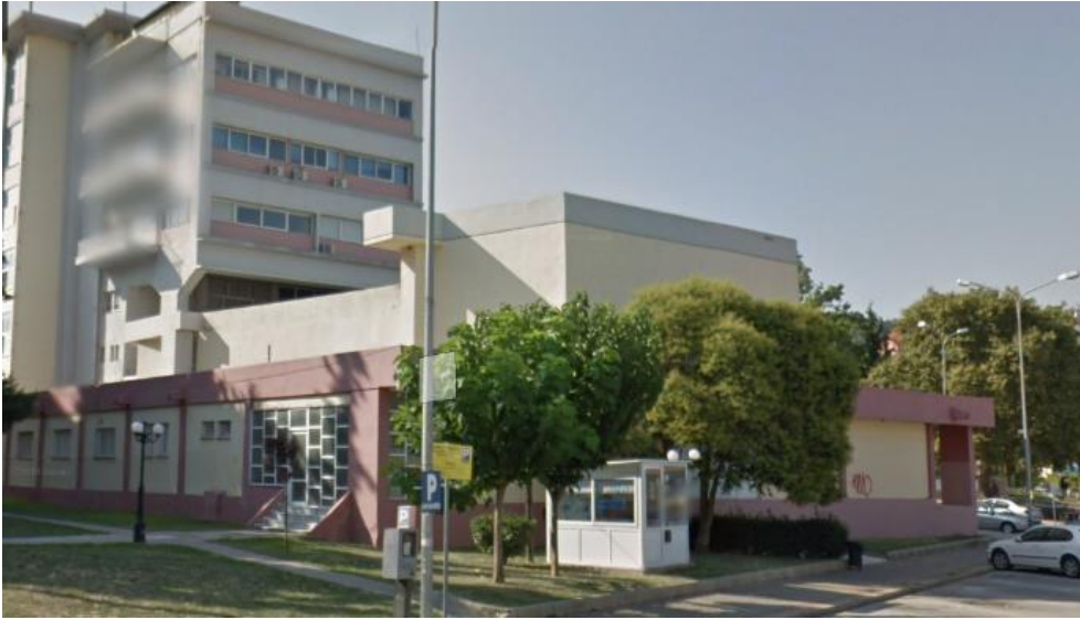
Εικόνα 5: Νότια όψη