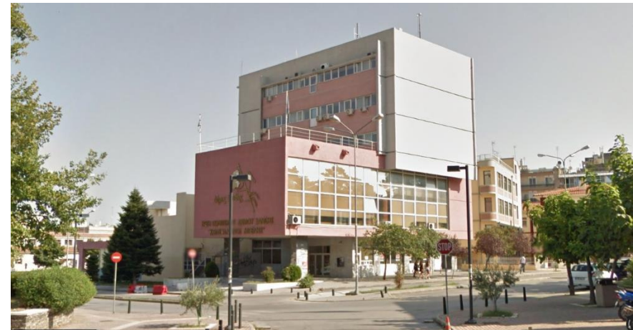
Εικόνα 2: Βορειοδυτική όψη