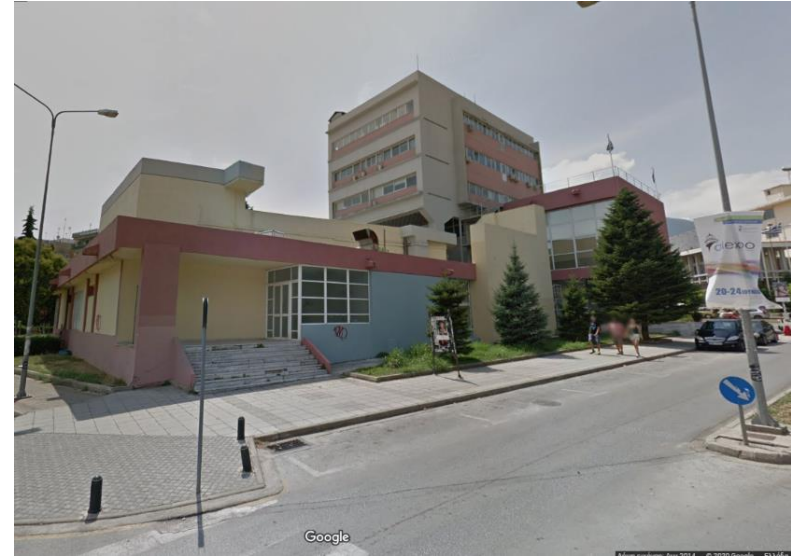
Εικόνα 6: Ανατολική όψη