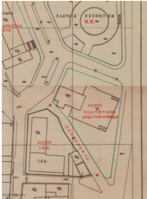
Εικόνα 3: Απόσπασμα ρυμοτομικού