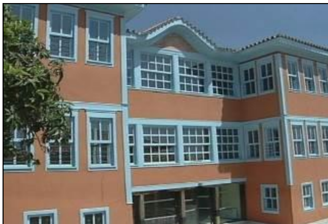
Εικόνα: Το Κονάκι του Μουζαφέρ Μπέη μετά από την αποκατάσταση

Στόχος του έργου είναι ο πολιτιστικός αυτός χώρος στο κτίριο του Μουζαφέρ Μπέη, να διαμορφωθεί και καθιερωθεί ως ένας σημαντικός πόλος έλξης για μικρούς και μεγάλους, ο οποίος μέσω ενός συνδυασμού ενημέρωσης και ψυχαγωγίας, θα στοχεύει στην κοινωνική ευαισθητοποίηση και προβληματισμό των παιδιών, έτσι ώστε να αποτελέσει ένα κέντρο μνήμης αλλά και προοπτικής σ' ένα τόπο που προσπαθεί να διατηρήσει τις ιδιαιτερότητές του και τις παραδόσεις του ζωντανές. Στους στόχους της παιδαγωγικής πολιτικής είναι και η αναβάθμιση του τόπου και της τοπικής κοινωνίας, αναδεικνύοντας μία πλευρά της πολιτιστικής κληρονομιάς του.