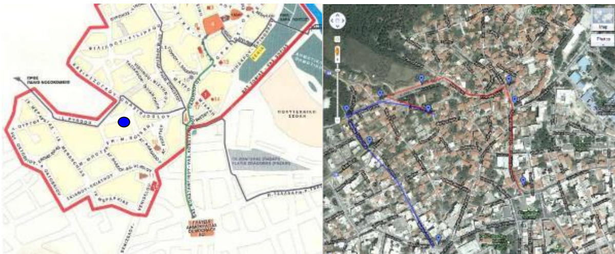
Εικόνα : Χάρτης και δορυφορική λήψη τμήματος της παλιάς πόλης της Ξάνθης με σήμανση