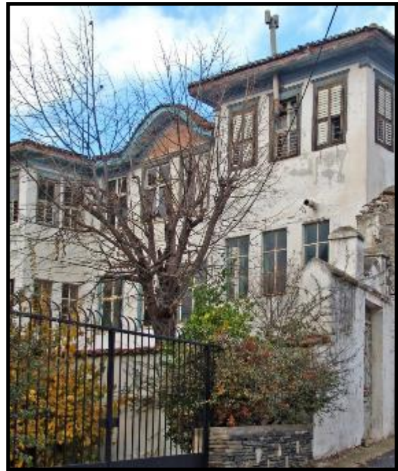
Εικόνα: Το κονάκι του Μουζαφέρ Μπέη σε φωτογραφία του 2006, πριν από την αποκατάσταση (δεξιά)