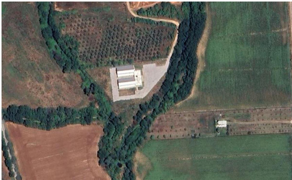
Φώτο 1: Καταφύγιο αδέσποτων ζώων συντροφιάς Δ. Ξάνθης

Υπάρχει καθημερινή παρουσία έμπειρου και εκπαιδευμένου προσωπικού για οχτώ ώρες ημερησίως, όπως άλλωστε προβλέπεται στην παρ.1 του άρθρου 28 του ν.4830/21.