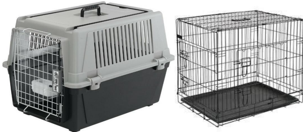
Φώτο 4: Κλουβιά μεταφοράς