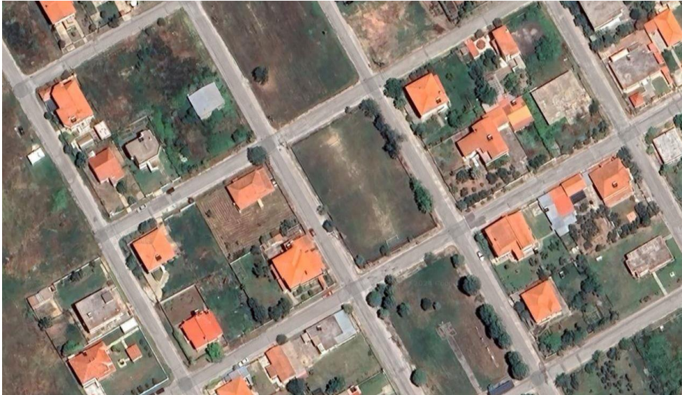
Φώτο 2: Περιφραγμένο γήπεδο οικισμού Πετροχωρίου

Ορίζεται το περιφραγμένο δημοτικό γήπεδο οικισμού Πετροχωρίου, το οποίο βρίσκεται πλησίον στο κέντρο του οικισμού. Έκταση: 2.242 τ.μ.