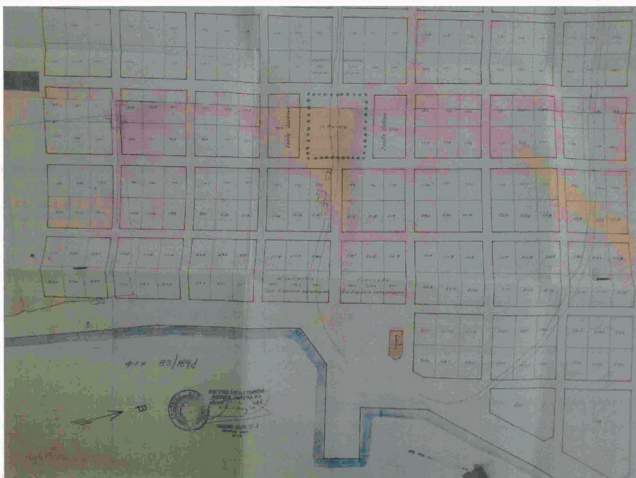
ΑΠΟΣΠΑΣΜΑ Ρ.Σ.(Χωρ. Κλίμακα) Ορθογώνιο Συντεταγμένο Κορυφών Τετραγώνων Τετραγώνων Ρ.Σ.σε ΕΓΣΑ 87.